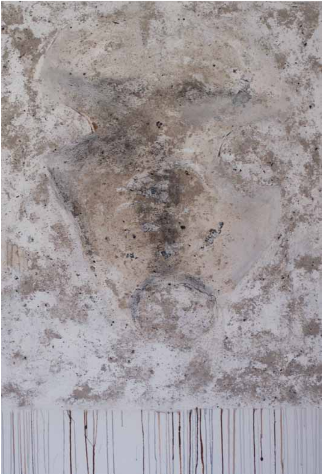
tête 2 150 x 100 cm - 2016 - acryl, plâtre, cendres, huile sur toile Acryl, Gips, Aschen, Öl auf Leinwand