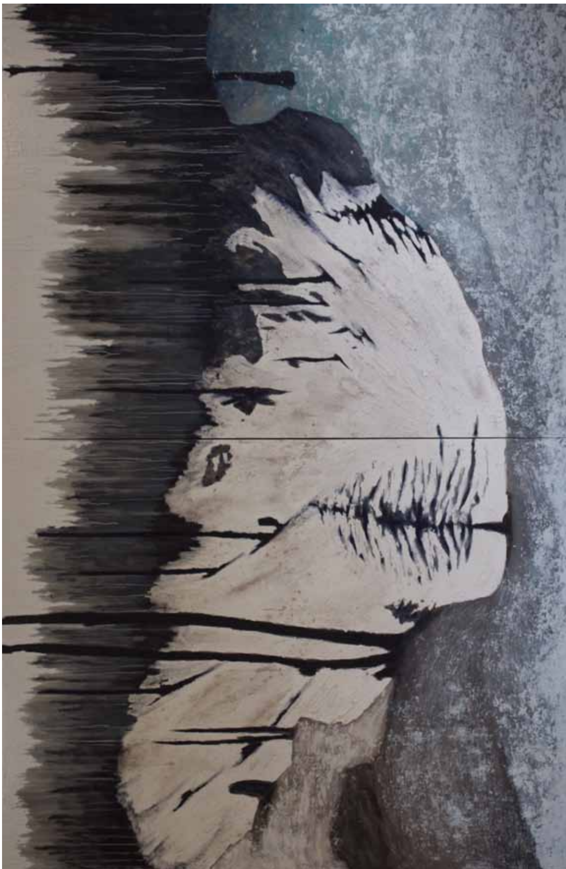
creux petou 253 x 384 cm - 2016 - acryl, plâtre, cendres, huile sur toile Acryl, Gips, Aschen, Öl auf Leinwand