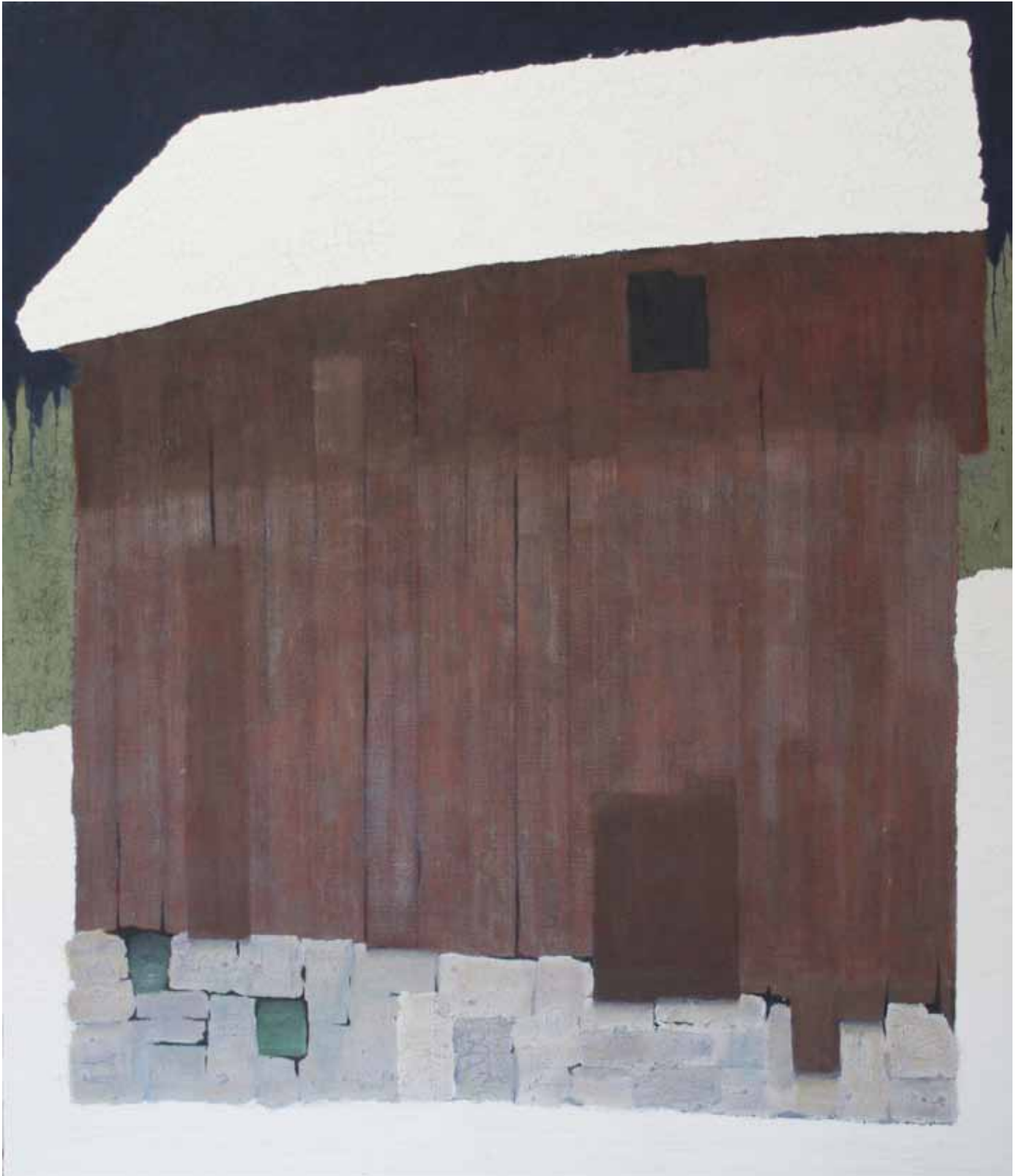
abri 1 244 x 208 cm - 2016 - acrylique, plâtre, huile sur toile Acryl, Gips, Öl auf Leinwand