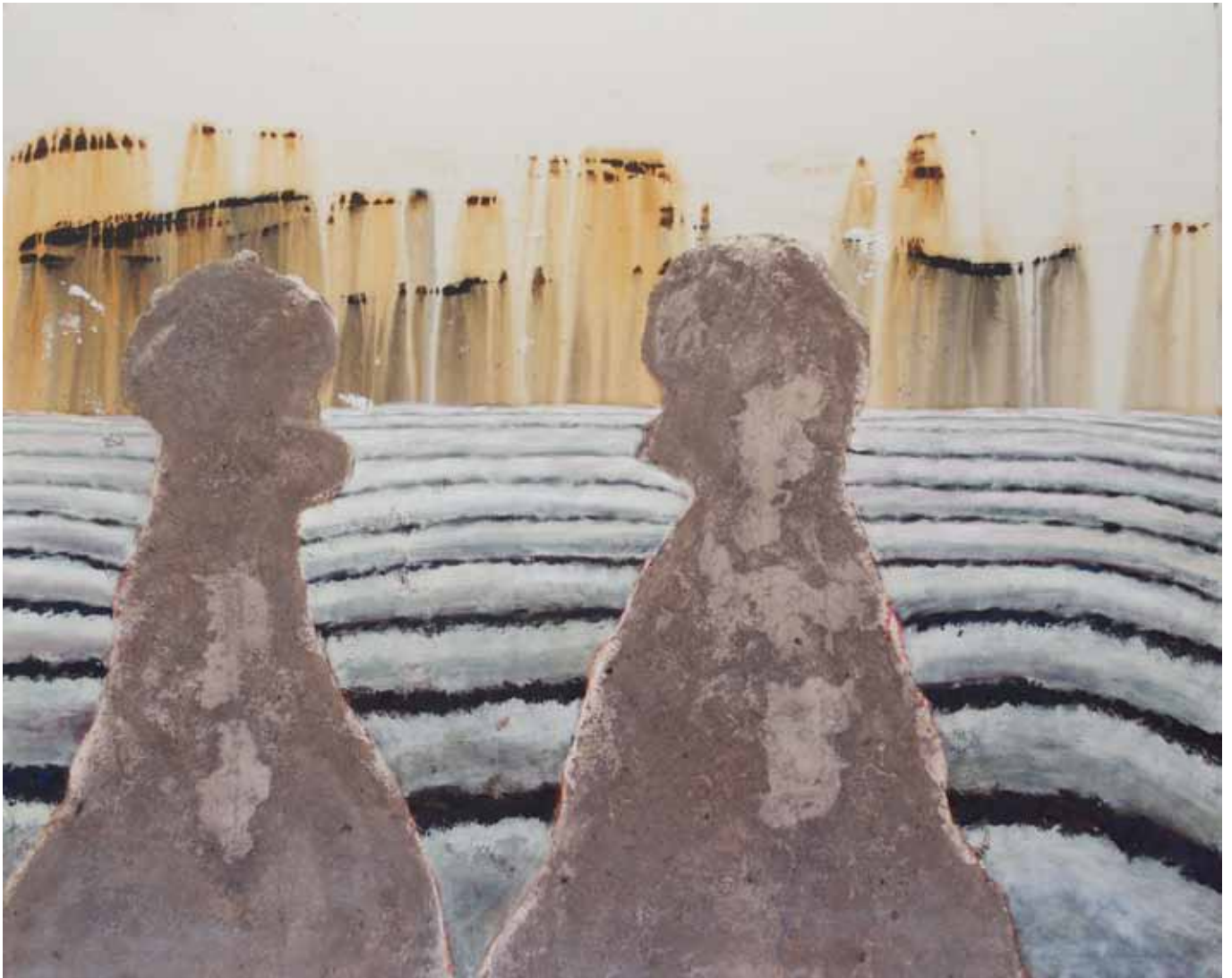
généraux désarmés 120 x 150 cm - 2016 - acryl, plâtre, cendres, huile, gomme laque sur toile Acryl, Gips, Aschen, Öl, Schellack auf Leinwand